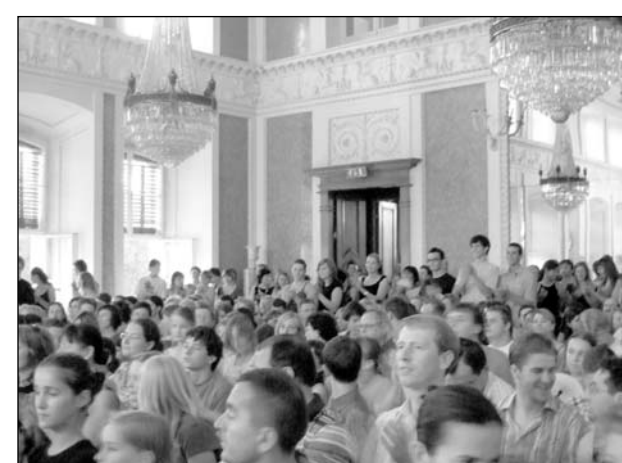
Podczas koncertów Sala Balowa wypełniona była po brzegi.